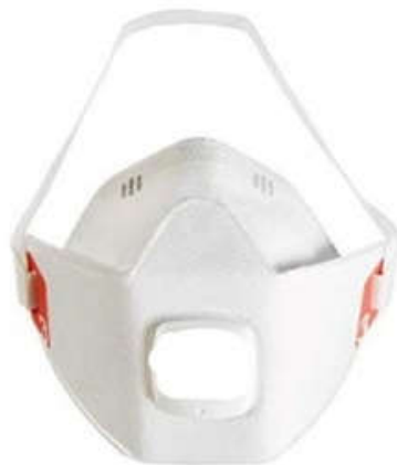
Fig. 3 Facciale filtrante

Per i facciali filtranti FFP1, FFP2 e FFP3 , definiti DPI, la legislazione di riferimento è costituita dal D.Lgs. 81/2008 e s.m.i. ed, in particolare, dal Titolo III, Capo II, nel quale sono state inserite le modifiche apportate con il D.Lgs. 17/2019 (atto di inserimento nell'ordinamento nazionale del Regolamento UE n. 2016/425 del Parlamento europeo e del Consiglio, del 9 marzo 2016, in materia di DPI).